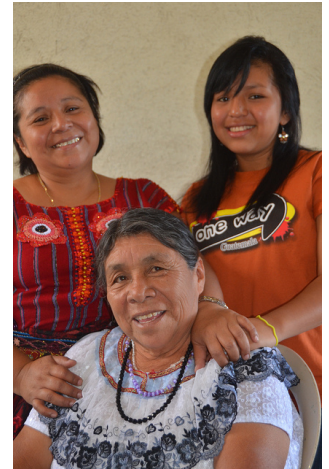
Three Generations by David Amsler (CC – BY – NC 2.0)